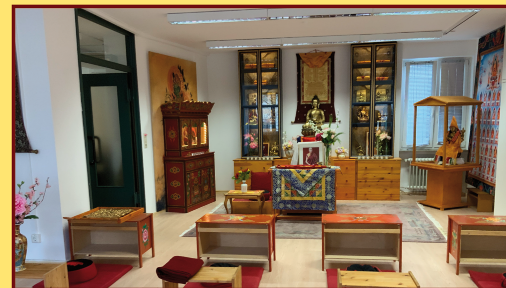
Die Gompa - der Meditationsraum im Sumati Kirti